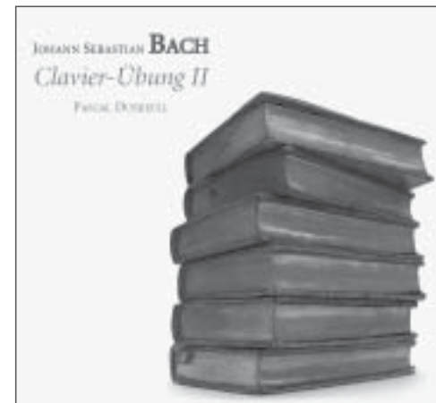
JOHANN SEBASTIAN BACH Clavier-Übung II RAM 1001