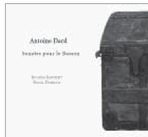
ANTOINE DARD Sonates pour le Basson RAM 0702